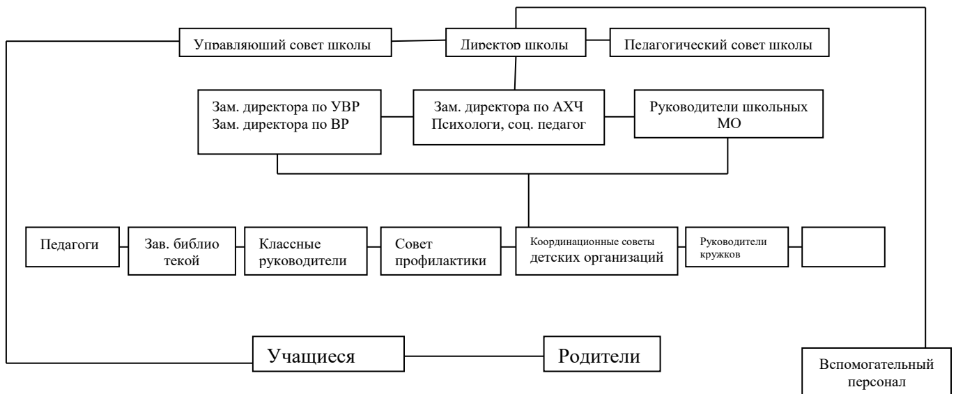
Схема структуры управления